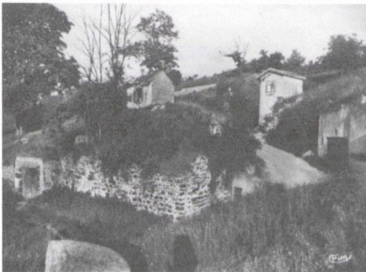
Carte postale ancienne représentant deux tonnes situées en haut de la rue des Grandes Caves