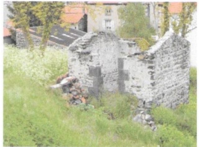
Tonne dans le quartier du « Grand Corridor » avant et après restauration par l'ASCA

Encore utilisée jusque dans les années 1950, la tonne est aujourd'hui menacée par le remembrement. Que devient une tonne dépouillée de ses vignes ? On n'y dort plus, on n'y installe plus son cheval. Beaucoup d'entre elles ont été progressivement abandonnées avec l'arrachage des vignes, consécutif, au début du XXème siècle, à la crise du phylloxéra et à l'extension des cultures céréalières. Avec leur disparition, c'est toute une page d'histoire qui se referme. Mais c'est aussi une présence du passé que l'on se doit de préserver pour les souvenirs qui s'y rattachent et le rappel à nous des bâtisseurs que furent nos ancêtres.