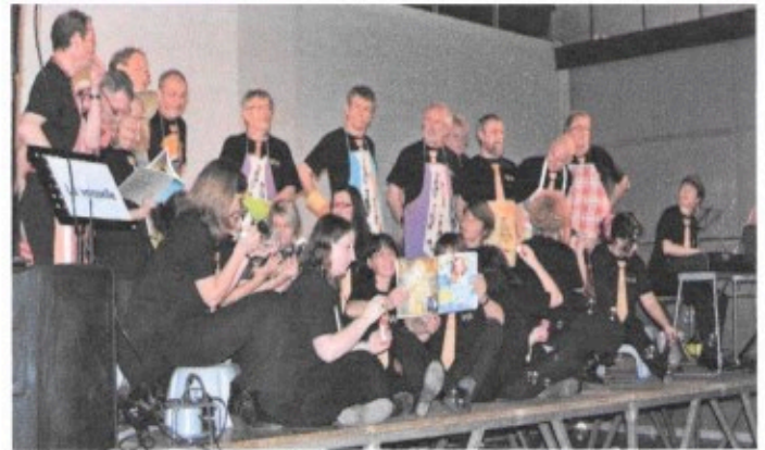
Les « Cravates en bois » dans la salle du Cosec

véritable perle de concert pour les 250 spectateurs venus les écouter dans la salle du COSEC. Cette soirée était organisée au profit de la restauration du Patrimoine viticole de la commune.