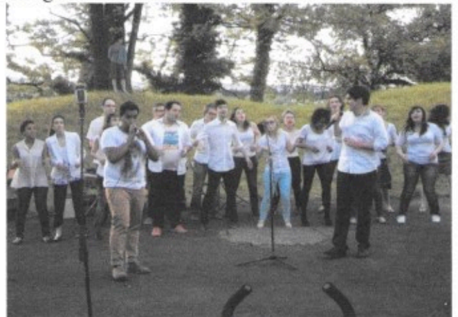
Le groupe « Sounds of Gospel »

L'ASCA a organisé, pour la deuxième année consécutive, une soirée musicale qui s'est déroulée au soleil couchant dans un cadre exceptionnel, face à la chaîne des puy. L'Harmonie d'Aubière a ouvert le programme, suivi par la chorale « Chant'Aubière ». Après une pause, ce fut le tour de l'ensemble étudiant « Sounds of Gospel » d'enchanter le public avec des négros spirituals teintés de soul music. L'école d'accordéon de Romagnat – Aubière a clôturé cette soirée.