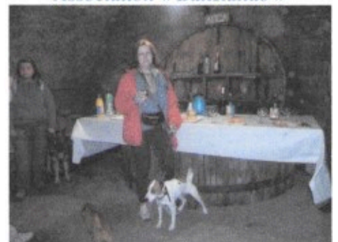
Le Club canin d'Aubière