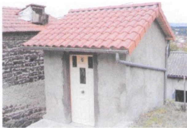
de l'Adèle, avant et après restauration par l'ASCA