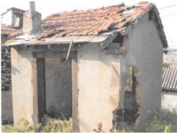
Tonne située à l'intersection des rue de Bacchus et

Susciter l'intérêt, mobiliser les volontés, là se trouve peut être la clef contre l'oubli qui ronge les maisons de vignes.