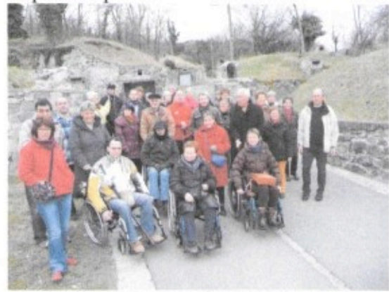
L'Association « HandiLettante »

Depuis le début de l'année, nous avons eu le plaisir de recevoir plusieurs associations. Nous mettrons plus particulièrement l'accent sur trois d'entre elles. L'association « HandiLettante » qui a permis en mars dernier, à des personnes handicapées de descendre dans nos caves, l'association 'les maçons de la Creuse » véritables descendants de nos bâtisseurs de caves et l'association « Balirando » un groupe composé d'une quarantaine de randonneurs. Pour ces trois associations, tout s'est terminé par un casse croute revigorant, servi dans les caves, arrosé par le vin blanc produit par l'ASCA .