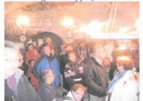
Association « BaliRando »