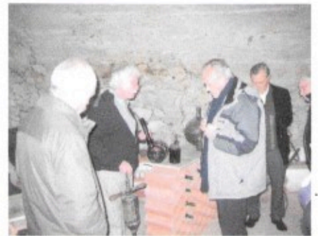
Monseigneur Hippolyte Simon