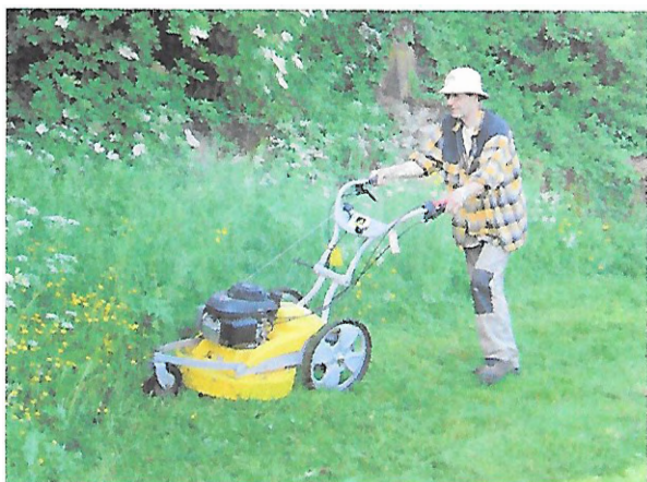
Désherbage devant notre vigne pédagogique

Un des principaux travaux de l'association, avec les travaux de maçonnerie consiste durant la période estivale, à entretenir le site des caves. Quelques propriétaires entretiennent le dessus de leur caves. Nous souhaiterions qu'ils soient plus nombreux. Merci à la Municipalité qui, à notre demande, désherbe, une fois par an environ 1 ha de terrain