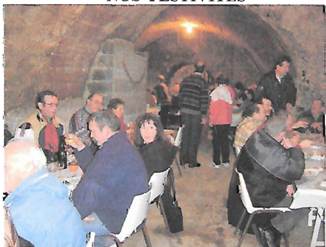
. La matinée « Huîtres et Tripes » en Décembre