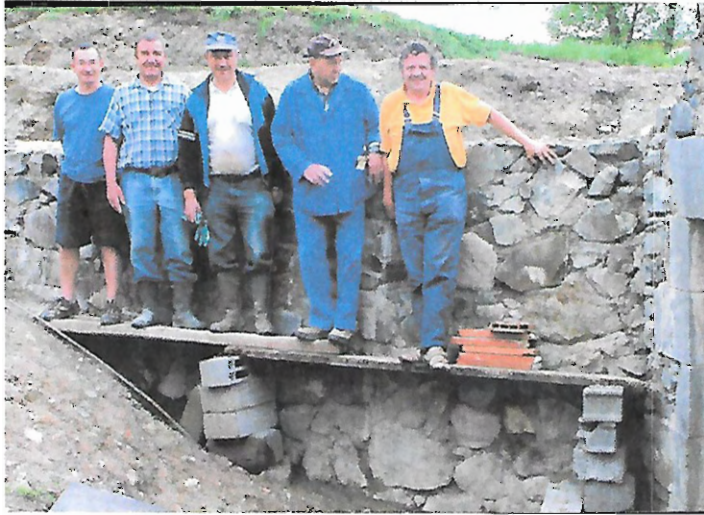
L'équipe du jeudi après midi devant le mur de soutènement de la « Cave du Soleil »