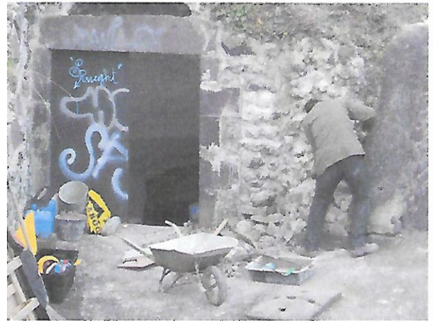
Rénovation d'un mur d'entrée de cave