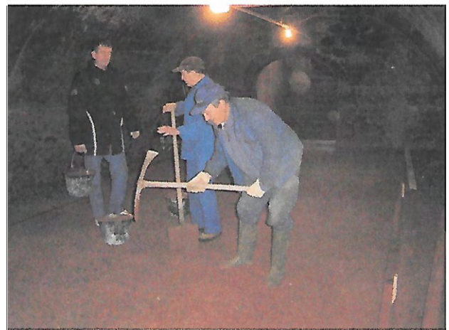
Mise à niveau de la « Cave sous la tonne » avant coulage de la dalle. Ce lieu, une fois rénové deviendra notre cave de réception