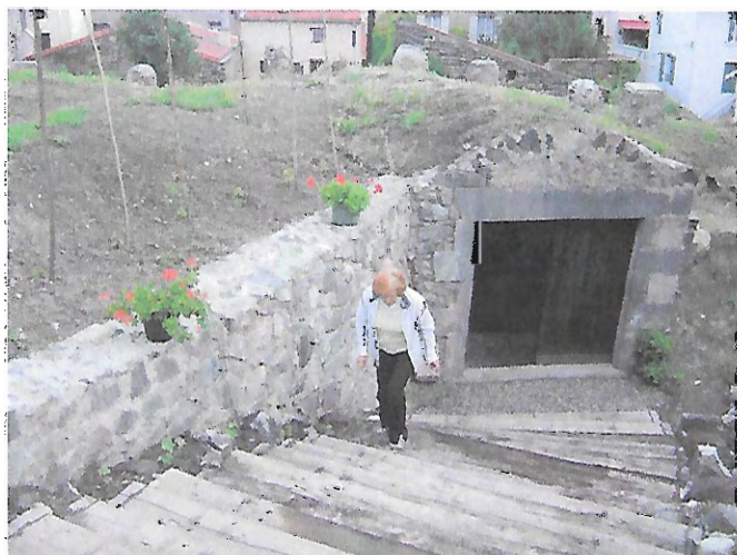
La « Cave du Soleil » une fois les travaux de rénovation terminés