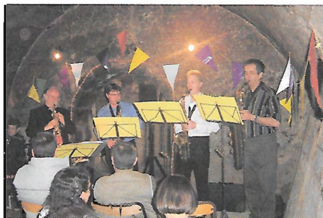
Jazz dans la « Cave Bacchus »

Un des principaux travaux de l'association, avec les travaux de maçonnerie consiste durant la période estivale, à entretenir le site des caves. Quelques propriétaires entretiennent le dessus de leur caves. Nous souhaiterions qu'ils soient plus nombreux. Merci à la Municipalité qui, à notre demande, désherbe, une fois par an environ 1 ha de terrain