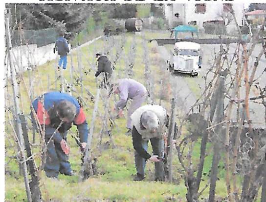
Taille de la « Vigne du Musée » en Mars

Depuis 2003, l'Association possède sa propre vigne et vinifie le produit des 500 ceps dont le vin blanc, du Chardonnay, est goûtée à chaque manifestation et visite de caves. L'ASCA travaille également depuis Mai 2007 la vigne du Musée de Basse Auvergne. Une autre vigne est travaillée. La vendange est vinifiée en vin rosé.